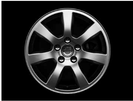
Oden 7,0 x 16"