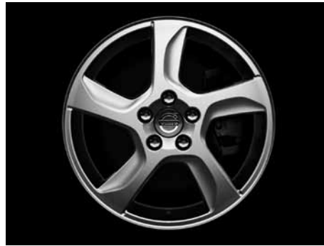
Balder 7,0 x 17"