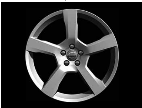
Cratus 8,0 x 18"