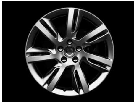
Sleipner 8,0 x 18"