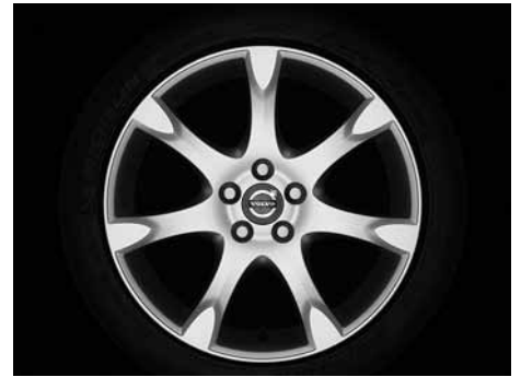
Fortuna 8,0 x 18"