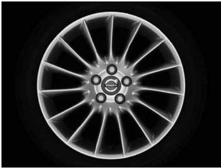
Balius 8,0 x 18"