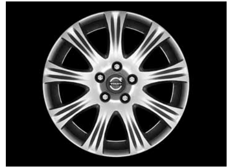
Cassini 7,0 x 17"