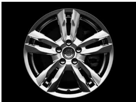
Njord 8,0 x 17"