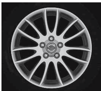
Spartacus 7,0 x 17"