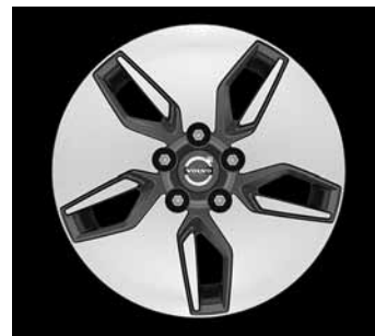
Libra 6,5 x 16"