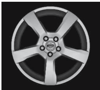
Cratus 7,0 x 17"

1) Entfall der Leichtlaufreifen. 2) Nicht in Verbindung mit Sportfahrwerk.