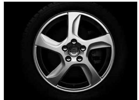
Balder 7,0 x 17"