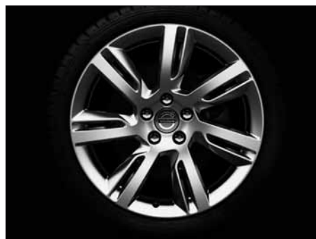
Sleipner 8,0 x 18"