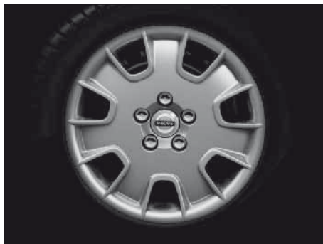
Stahlfelge 7,0 x 16"