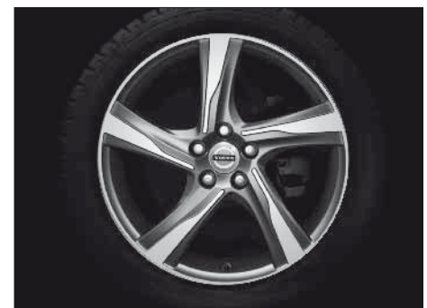
Ixion 8,0 x 18"