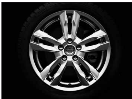
Njord 8,0 x 17"