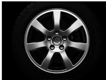
Oden 7,0 x 16"