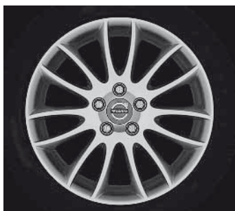
Spartacus 7,0 x 17"