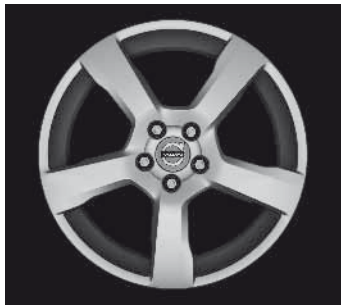
Cratus 7,0 x 17"

1) Entfall der Leichtlaufreifen. 2) Nicht in Verbindung mit Sportfahrwerk.