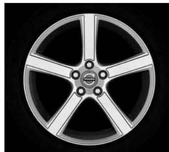
Midir 7,5 x 18"