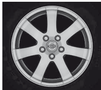
Cordelia 6,5 x 16"