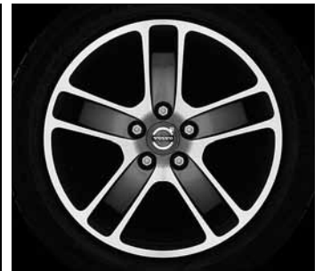
Zaurak Graphit/Silber 7,0 x 17"