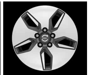
Libra 6,5 x 16"