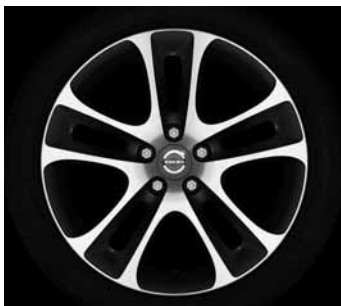
Atreus 7,5 x 18"