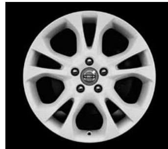
Styx White 7,0 x 17"