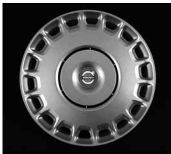
Stahlfelge mit Radzierblende