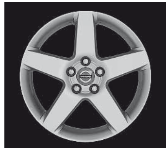
Serapis 7,0 x 17"