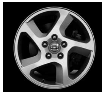
Convector 6,5 x 16"