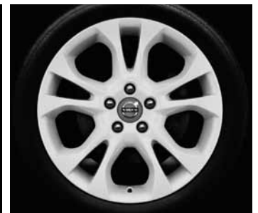
Styx White 7,0 x 17"