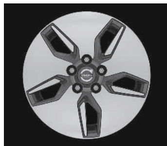
Libra 6,5 x 16"