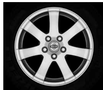
Cordelia 6,5 x 16"