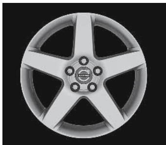
Serapis 7,0 x 17"

2) Nicht in Verbindung mit Sportfahrwerk.