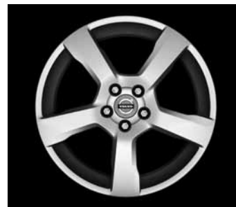
Cratus 7,0 x 17"