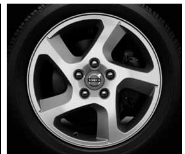
Convector 6,5 x 16"