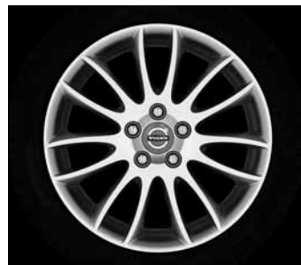
Spartacus 7,0 x 17"