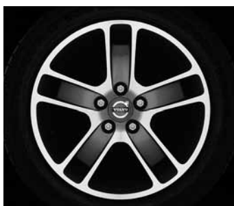
Zaurak Graphit/Silber 7,0 x 17"